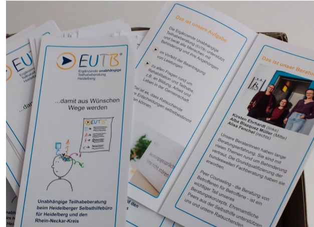
Die neuen Flyer.

Das ist ein perfekter Start in 2022: Unser Team freut sich, im neuen Jahr auch einen neuen Flyer präsentieren zu können. Er ist digital als pdf auch auf unserer Webseite zu finden. Gedruckte Exemplare können gerne unter 06221/16 13 31 bestellt werden.