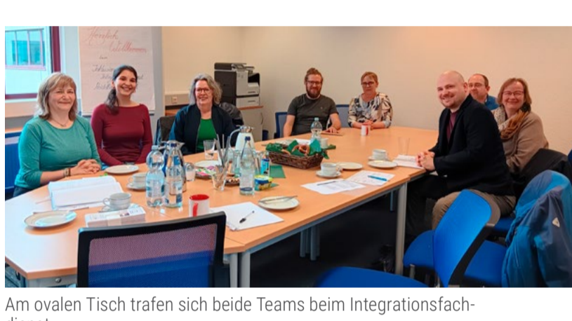
Am ovalen Tisch trafen sich beide Teams beim Integrationsfachdienst.

EUTB®-Berater:innen hatten auch Themen und viele Fragen mitgebracht. Es ging vor allem um Berührungspunkte und Schnittstellen zur Teilhabeberatung. Unsere Berater:innen erleben fast täglich: Arbeit ist ein wichtiges Thema für Menschen mit Behinderung, aber leider oft kein leichtes. Am Ende wurde vereinbart, dass dieses wichtige Treffen künftig einmal im Jahr stattfinden soll.